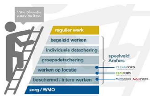
figuur 1: werkladder

• Mobiliteit – Om stappen te zetten naar hogere treden op de werkladder (figuur 1) en een plek dichterbij de reguliere arbeidsmarkt stimuleren wij de ontwikkeling van arbeidsvaardigheden. 2016 kende een groei van 2.5% in externe plaatsingen. Voor het overgrote deel is dit gerealiseerd via groepsdetacheringen. Bij individuele detacheringen bleef de groei beperkt, ondanks het feit dat er in 2016 in totaal 32 medewerkers zijn gestart in een detachering. Tegenover deze nieuwe detacheringen staat een uitstroom in verband met pensionering, terugval, re-integratie (tijdelijke interne plaatsing).