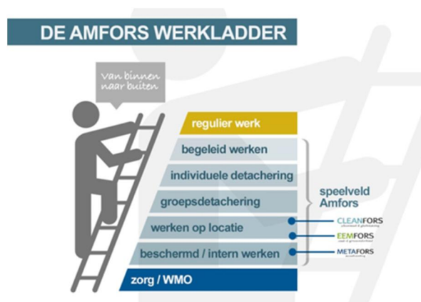
Figuur 2: De Amfors werkladder

Mobiliteit is één van de belangrijkste speerpunten voor Amfors. De nadruk ligt op het realiseren van een verdere groei van detacheringen. We blijven Sw-medewerkers stimuleren en ondersteunen in de ontwikkeling om zo regulier mogelijk te werken en stappen te maken op de werkladder. In tabel 1 is een overzicht gegeven van de gerealiseerde doorstroom op de werkladder en het resultaat in 2017. In totaal is er 39 SE in 2017 wegens natuurlijk verloop uitgestroomd (pensionering, overlijden of arbeidsongeschiktheid). Daarnaast is circa 10% (106 SE) van de medewerkers van werkplek veranderd.