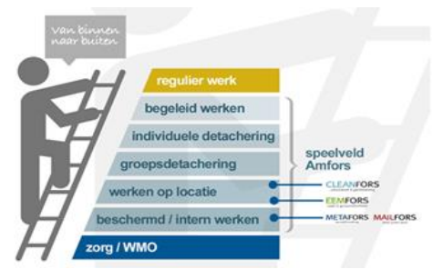
figuur 1: werkladder

• Mobiliteit – Het afgelopen jaar is Amfors, in goed overleg met de betreffende klanten, er in geslaagd om een aantal groepsdetacheringen om te zetten naar individuele detacheringen. Door deze stap op de werkladder wijken de resultaten in positieve zin af van de aantallen zoals genoemd in de begroting en de Prestatie-Overeenkomst 2018. In tegenstelling tot voorgaande jaren is er dit jaar meer belangstelling bij werkgevers voor begeleid werken, zoals uit de cijfers blijkt.