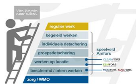
figuur 1: werkkladder

• Mobiliteit – De realisatie van de verdeling op de werkkladder ligt in 2019 nagenoeg in lijn met de verwachte verdeling zoals die in het WSW Prestatieovereenkomst 2019 is afgegeven. Dat de aantallen lager liggen dan in de Meerjarenbegroting 2019 – 2022 ligt hem in het feit dat in de betreffende MJB de medewerkers met een slapend dienstverband nog in de aantallen zijn opgenomen.