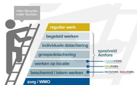
figuur 1: Werkladder

Mobiliteit – De realisatie van de verdeling op de werkladder ligt in 2021 in lijn met de verwachte verdeling zoals die in de begroting over datzelfde jaar is opgenomen. De focus ligt inmiddels meer op het realiseren en behouden van een passende duurzame werkplek waar rekening is gehouden met de mogelijkheden en beperkingen van de betreffende Sw-medewerker. Ultimo 2021 tellen we 773 SE (arbeidsjaren voor Sw-ers) tegenover 832 SE in 2020. Een krimp van circa 7%.